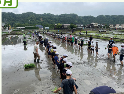
▲田植え当日の様子