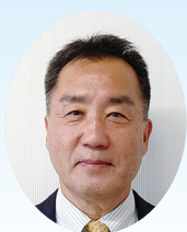
教育長職務代理者

児童に昼食後の歯磨きを推奨してインフルエンザ感染者数を減らした自治体の実績が報告されています。インフルエンザ予防に歯磨きを加えることは、日本歯科医師会が推奨しています。新型コロナウイルス感染予防だけでなく、インフルエンザ感染にも心を配ってください。