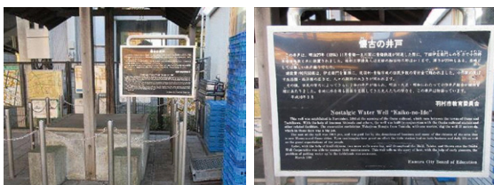
▲文化財説明板 (写真は、JR小作駅東口にある懐古の井戸です。)

このほかにも、市内には羽村の歴史や文化を知ることができる「文化財説明板」が設置されています。また、羽村市公式サイトで「文化財説明板位置図」を公開しています。市内の文化財巡りなどに活用してください。