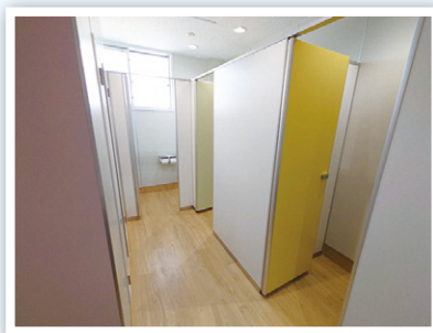
▲全体的に明るいトイレに