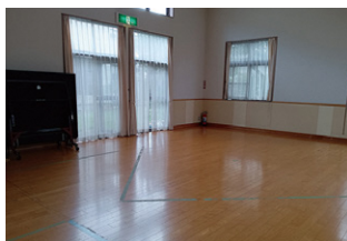
▲多目的室では、体育を行います。