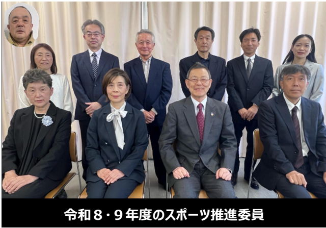
令和8・9年度のスポーツ推進委員

羽村市羽加美1-29-5 S&Dスポーツアリーナ羽村内 電話042(555)0033