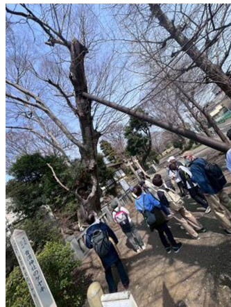
青渭(あおい)神社のケヤキ