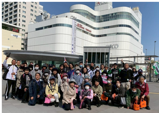
調布駅付近での集合写真