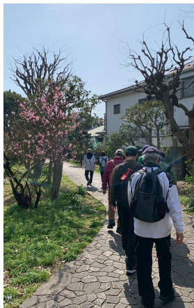
記念の森児童遊園