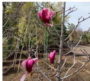
深大寺自然広場の桜↑ 色鮮やかな木蓮→

途中に立ち寄った布多天神社や祇園寺では、神社仏閣ならではの静寂した雰囲気味わうことができ、ゴールの深大寺と合わせて「都会のオアシス」を感じることができました。