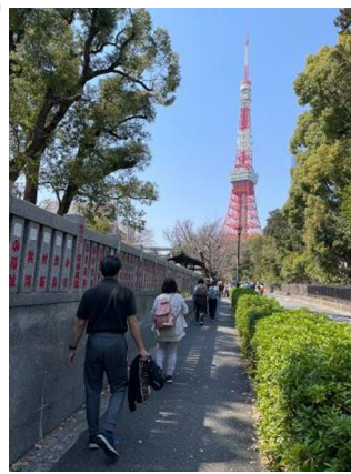
増上寺から東京タワーへ

今後とも四季のウォークを通して、皆様に楽しんで頂けるように内容を考えて参ります。