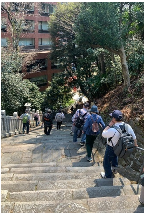
ゆっくり女坂を下ります

東京のパワースポットである愛宕神社では、男坂と呼ばれる斜度角度40度・86段の急な石段（通称、出世の階段）があまりに急で驚きました。登る時は恐怖心が増すので、振り返らず一気に登りましょうとの事です。男坂の隣には女坂という緩やかな階段もあるので、女坂で帰る方が多いそうです。