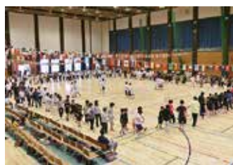
▲皆さんで親睦を深めましょう