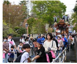
昨年の山車の巡行

川崎西町内会として、山車の巡行に参加します。今年、羽村駅前での山車の曳き合わせはありません。