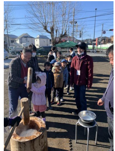
昨年の餅つき大会

内容：餅、赤飯、おつまみ、漬物、ずりだしうどん、飲物(アルコール類、ソフトドリンク)