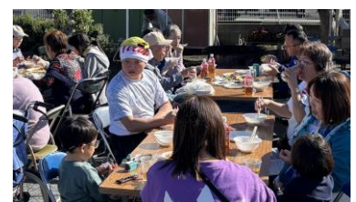
上:歩け歩け大会 下3枚:いも煮会