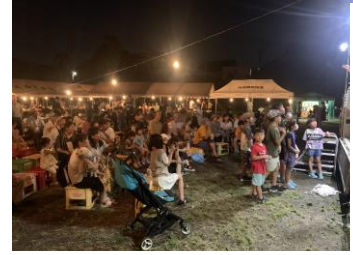
昨年の納涼の夕べ

4月26日に開催した第1回役員会で、令和7年度川崎西町内会の行事日程等が下表のように決まりました。今後、詳細については、回覧板を通じてお知らせしてまいります。皆様の参加とご協力をお願いします。