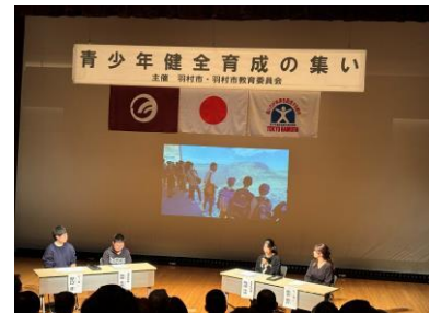
■大島・子ども体験塾活動報告

なお、「ゆとろぎ」前の道路などでは、子どもフェスティバルが行われ、子どもたち による模擬店、地区委員会の活動展示などが行われました。