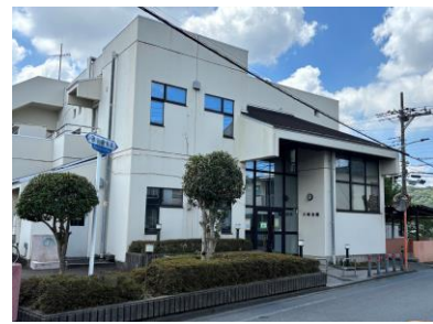
■地域集会施設川崎会館

7月8日開催の町内会連合会会議において、市から「将来にわたり厳しい財政状況が予測されることから、公共施設を見直し・統廃合する構想がある」との説明があり、現在、市内に23カ所ある地域集会施設(会館)を10カ所に縮小していくとの案が示されました。川崎地区においても、川崎東・西、上水通り地区に1カ所とする計画となっています。地域集会施設の統廃合は、令和13年度から17年度までを当面の実施時期とする予定であるとのことでした。既存の会館が廃止となる町内会・自治会もあることから、大きな影響があります。今後、町内会連合会として検討、対応を図っていくこととなりました。