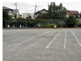
■整備された児童遊園

町内会会員の皆様、秋も深まり、寒さも一段と厳しくなってまいります。どうぞ、ご自愛ください。