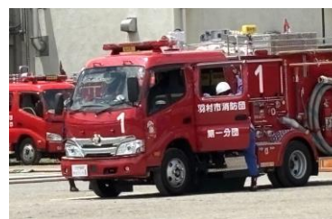
■ポンプ操法審査会