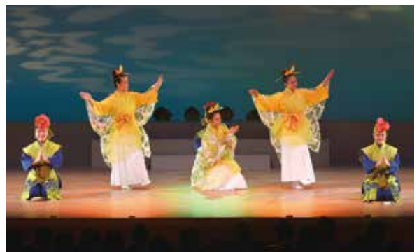
▲ (上) ファミリー・サポート・センター事業 (下) 伝統文化交流事業 in ゆとろぎ