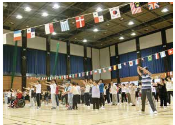
▲ 障害者スポーツ・レクリエーションのつどい