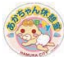
▲あかちゃん休憩室はこのステッカーが目印です

○ビューティークレヨン小作店(小作台5-15-16) ○総合衣料しもだ(羽西2-5-13)