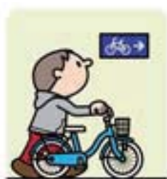
▼小作駅周辺の自転車駐車場と放置禁止区域

※市の条例で、羽村駅・小作駅を中心に半径400m以内の区域を自転車放置禁止区域に指定しています。