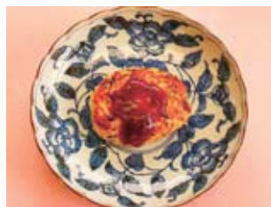
▲豆腐とひじきの時短ハンバーグ