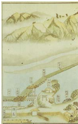
▲羽村堰(明治20年ごろ)

申込み・問合せ いずれも9月15日(火)午前10時から、電話で郷土博物館へ ☎ 558-2561(月曜日を除く午前9時～午後5時)