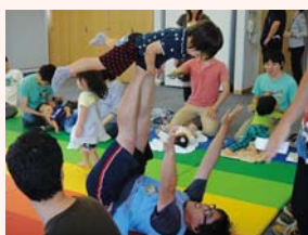
▲▲昨年の講座の様子