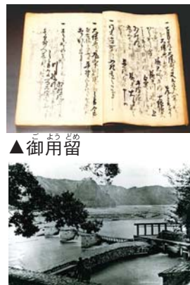
▲羽村堰(明治20年ごろ)