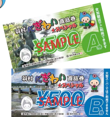
▲商品券のデザイン