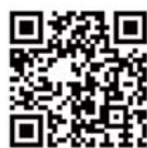
▲はむりんエントリーページ QR コード