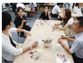
▲みんなで話してみませんか