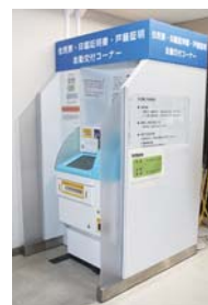
▲戸籍に関する証明が交付できません