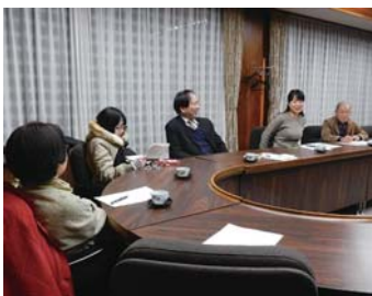
▲実行委員会の様子 あなたも企画・運営に携わってみませんか