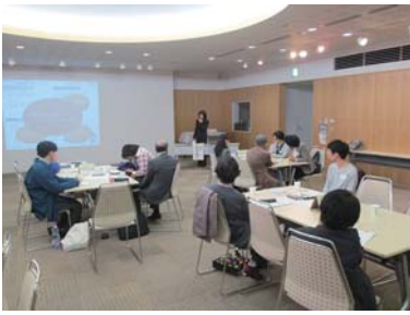
▲意見交換の様子 参加した皆さんで、活発な意見交換が行われました

介護費用、家族・地域との連携、そして仕事と介護の両立など、これからの時代の介護において、考えなくてはならないことは多々あるものの、共通して言えるのは、どれも日ごろからのコミュニケーションが重