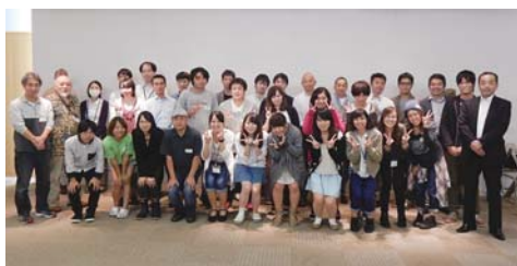
▲みんなで一緒に話してみませんか