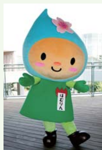
▲はむりんがやってきました