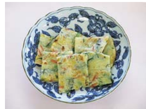
▲野菜たっぷり5色のチヂミ