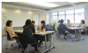
▲昨年の講座の様子