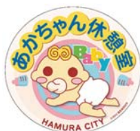
▲あかちゃん休憩室ステッカーが目印です