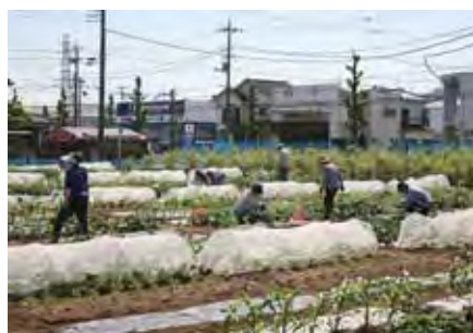
▲自分の区画にはいつでも入れます