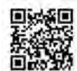
▲申込みフォーム QRコード

問合せ プラチナ未来スクール実行委員会事務局(企画政策課企画政策担当) ⑨ 313