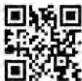
▲登録用 QR コード