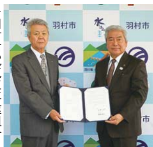
▶羽村市電気工事業組合との協定の様子