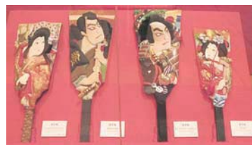
※写真はいずれも昨年度の展示