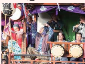
▲羽村の祭ばやし保存連合会