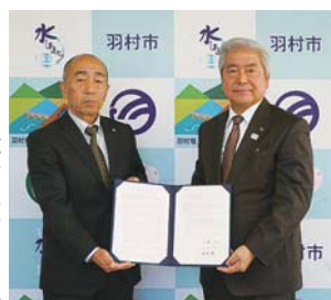
▶西多摩電設工業協同組合との協定の様子