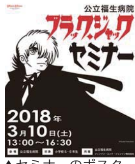
▲セミナーのポスター

●応募先・問合せ 公立福生病院地域医療連携室〒197-8511福生市加美平1-6-1 ☎551-1111 ※詳しくは、公立福生病院ウェブサイトをご覧ください。