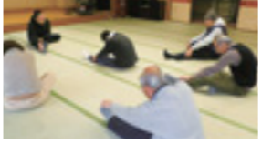
▲準備体操の様子 (椅子は使いません)

※時間は各回午前9時30分～11時30分 会場 コミュニティセンター1じゅらく苑1階老人集会所 対象 65歳以上の方 定員 30人(当日先着順) 持ち物 運動できる服装、汗拭きタオル、飲み物、筆記用具、緊急連絡先の控え ※体調は自己管理で参加してください。