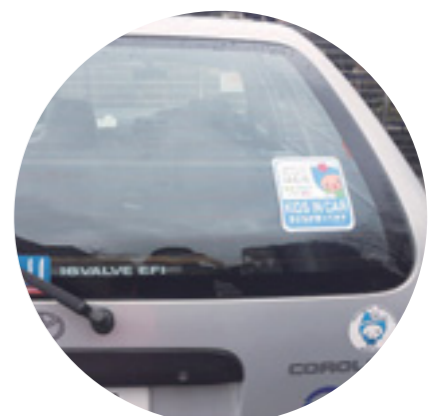
▲車に貼ったイメージ