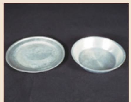
▲(左)平たい方がパン、(右)深い方がおかず用。パンはコッペパンが多かった。