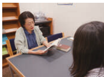
▲対面朗読サービス

◆録音図書 (DAISY (デージー) 版図書) 貸出 ◆対面朗読サービス ◆宅配サービス