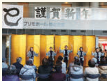
▲陽気な節回りで場を盛り上げる伝統芸・南京玉すだれや箏・尺八の演奏などでお正月気分を楽しみましょう。