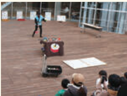
▲コマ回しの妙技を見たり体験したり、昔遊びも楽しむことができます！