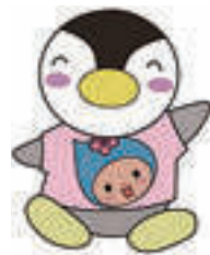
▲東京都民生児童委員連合会 マスコットキャラクター ミンジー×はむりん

生活上の悩みや困りごとがあれば、地域の民生委員・児童委員に気軽に相談してください。