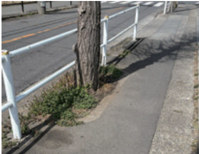
街路樹により歩行スペースが狭くなっている歩道

市長 他の自治体では、「街路樹更新計画」や「街路樹マネジメント方針」などを策定していることは承知している。先進事例を参考に街路樹に関する計画について、調査・研究する。