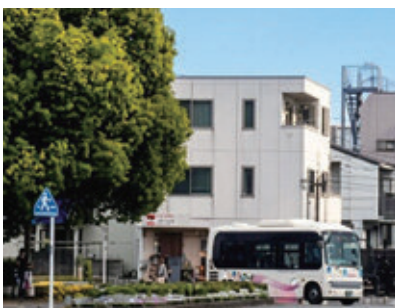
令和8年4月から土日・祝日、年末年始の運行を取り止めたコミュニティバス「はむらん」