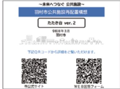
羽村市公共施設再配置構想 (たたき台 ver.2)

質問 業務効率化の観点からも、事業者が来庁することなく依頼・提出ができるような工夫が必要では。 市長 参考見積りについては、メールやFAXでの提出など柔軟に対応している。一部の契約事務は来訪を求めめる場合があるが、事業者の事務負担軽減について引き続き研究していく。 新たな歳入の確保について 質問 庁舎内や市内公共施設で不要となった備品などをフリーマーケットサイトで販売してはどうか。 市長 再利用の推進を図るとともに、売却による歳入の確保や廃棄コストの抑制に努める。フリーマーケットサイトの活用については、既に取り組んでいる自治体の事例を参考に、費用対効果を検証するとともに、調査・研究していく。