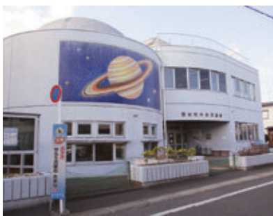
公共施設再配置構想のたたき台では廃止の方向性が示された中央児童館

質問 市民への意見聴取と更に検討を深める方法を、市はどう考えているか。また、施設ごとに検討する会を数多く開いては。 市長 施設ごとに意見聴取の場を設けることはせず、利用者も含め、多くの市民が参加しやすい意見聴取の方法を検討する。 質問 子供の居場所への要望が高まっている今、3館ある児童館全てを存続する検討も必要では。 市長 子供の居場所づくり