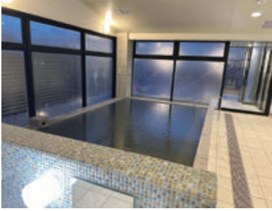
2月1日リニューアルオープンしたフレッシュランド西多摩「よつ葉の湯」

市長 この機会を好機と捉え、観光振興を通じた市の発展に繋がるよう、取り組んでいく考えである。具体的には、市公式サイト、SNSを活用した施設情報の発信のほか、羽村市観光協会と連携し、観光パンフレットへの掲載等、市内外へ