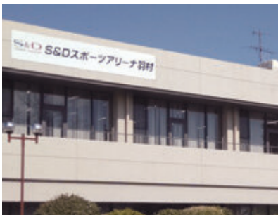
日影規制に抵触していることが判明したスポーツセンター