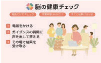
電話による脳の認知機能チェック

けたいと思えるまちづくりのため、市でも就労支援や働き方に関する施策にジェンダーギャップ解消の視点を反映させるべきでは。