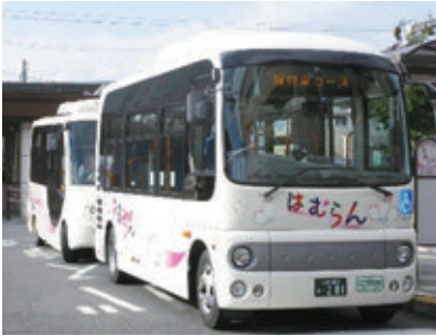
コミュニティバス「はむらん」

質問 コミュニティバス「はむらん」の土日・祝日等の運行取り止めによるフレッシュランド西多摩「よつ葉の湯」利用者の移動手段をどうサポートするのか。 市長 デマンド型交通等、様々な交通手段の有効性や必要性について調査・研究する。