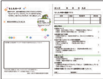
福生市で配布している「もしもカード」

質問 お薬手帳に本人の死生観などを記載する仕組みは有効と考える。福生市の簡易版エンディングノート「もしもカード」のような取組を実施する考えは。