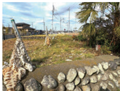
羽村大橋からJR踏切までの都道3・4・12号線予定地。完成時期は不明。