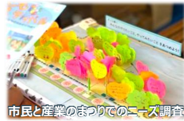
市民と産業のまつりでのニーズ調査

水上公園の今後の利活用について、令和7年7月に全市民対象のアンケート調査を実施し、11月には市民と産業のまつり来場者を対象にニーズ調査をしました。