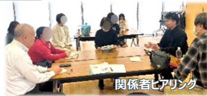
関係者ヒアリング

子供と関わる保育園・幼稚園・子供の遊びに関わる団体を対象に、遊びの状況を聞き、意見やアイデアを募りました。