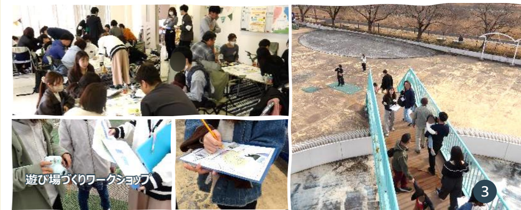
遊び場づくりワークショップ