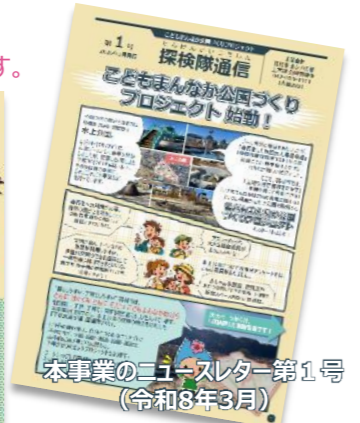
本事業のニュースレター第1号 (令和8年3月)